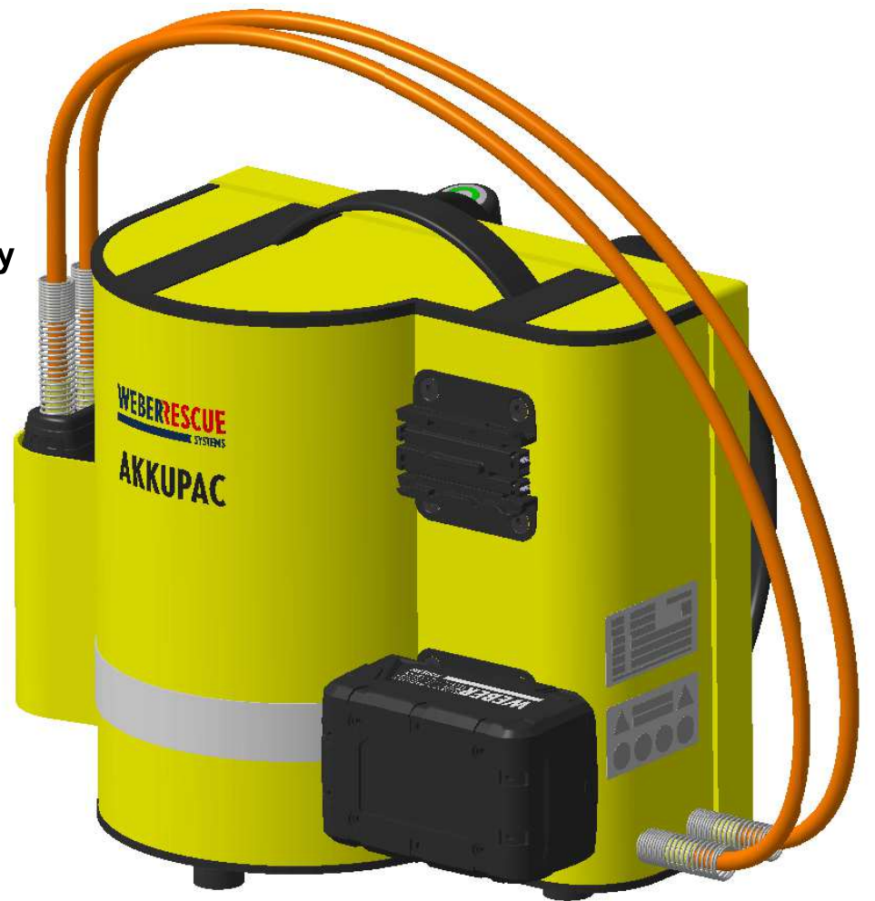
Option 2. Akku (2 nd BATTERY OPTIONAL)

ECO-Schaltung/ECO-drive: Automatische Drehzahlregelung für Energie sparenden Betrieb mit maximaler Laufzeit. (automatic speed control for saving energy at maximum runtime)